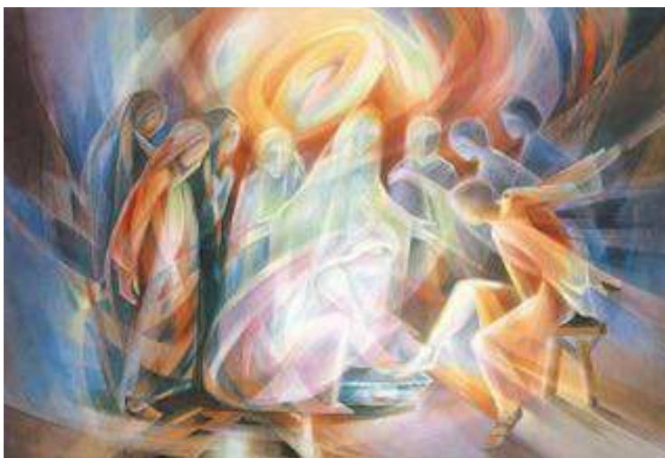
El Lavado de Pies Acuarela por Leszek Forczek